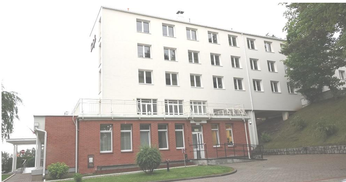
Fot. 3. Jastrzębia Góra, budynek „Bałtyk” Filii KSS, ul. Bałtycka 28, elewacja południowa (segment A i B).