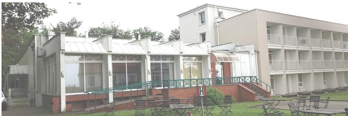
Fot. 9. Jastrzębia Góra, budynek „Bałtyk” Filii KSS, ul. Bałtycka 28, segment C – elewacja wschodnia i północna, segment B – elewacja wschodnia i północna.