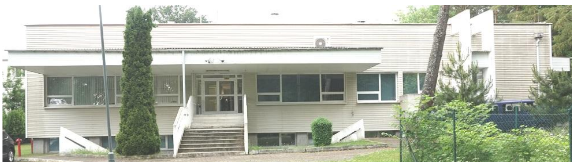
Fot. 7. Jastrzębia Góra, budynek „Bałtyk” Filii KSS, ul. Bałtycka 28, elewacja południowa (segment C).