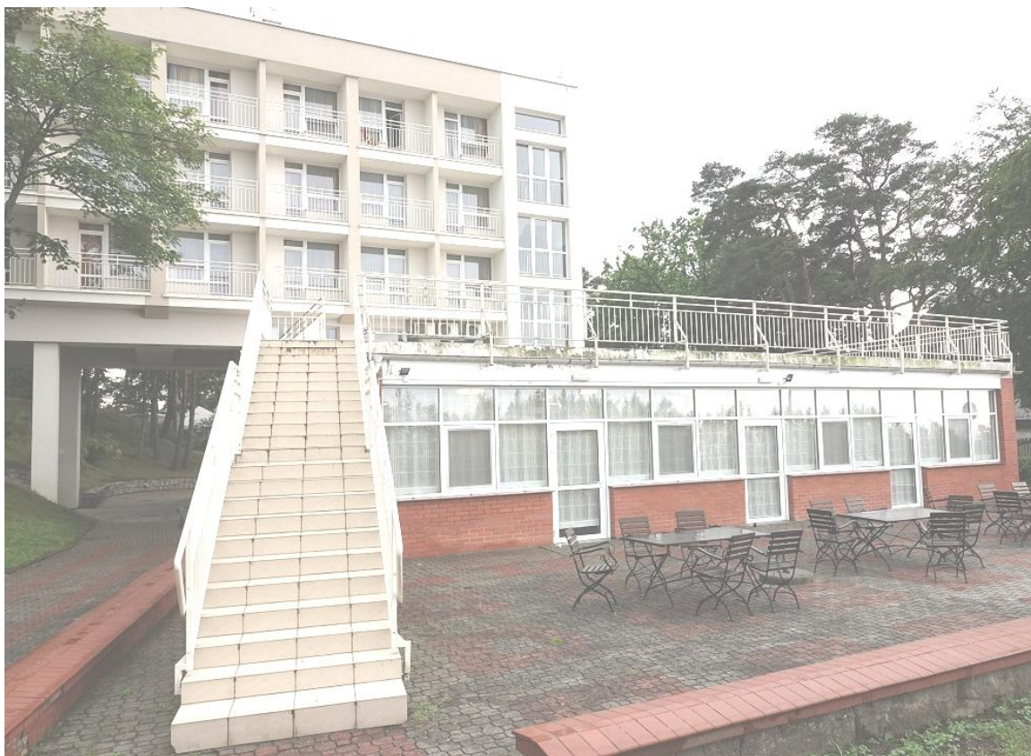
Fot. 11. Jastrzębia Góra, budynek „Bałtyk” Filii KSS, ul. Bałtycka 28, elewacja północna (segment B i A).