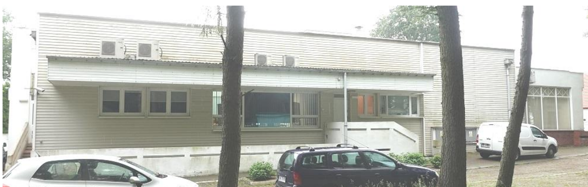
Fot. 8. Jastrzębia Góra, budynek „Bałtyk” Filii KSS, ul. Bałtycka 28, elewacja wschodnia (segment C).