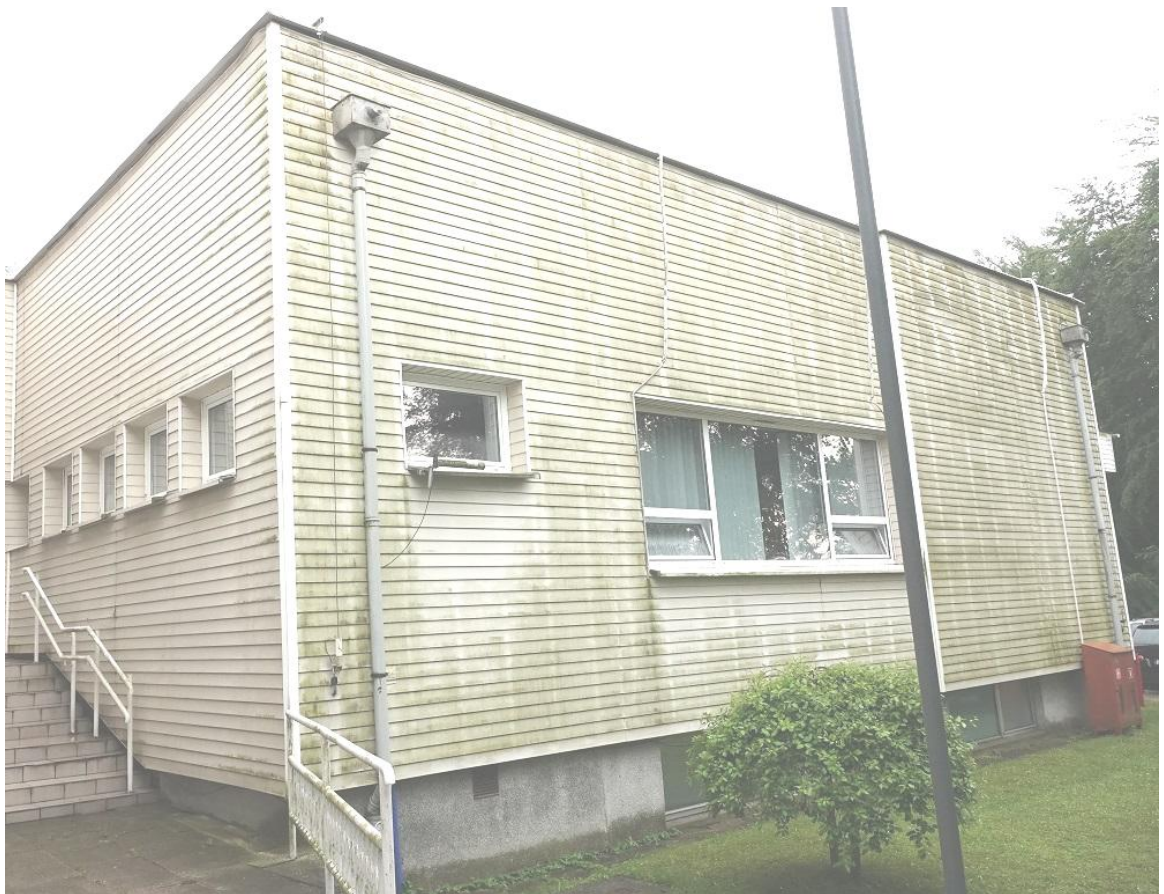
Fot. 5. Jastrzębia Góra, budynek „Bałtyk” Filii KSS, ul. Bałtycka 28, elewacja północna i zachodnia (segment C).