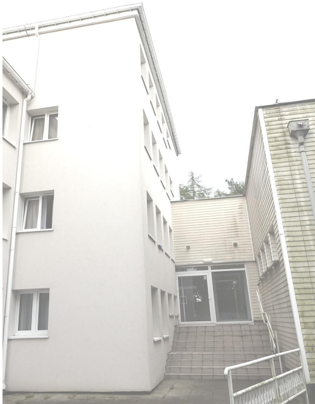
Fot. 4. Jastrzębia Góra, budynek „Bałtyk” Filii KSS, ul. Bałtycka 28, segment B – elewacja zachodnia i południowa, segment C – elewacja zachodnia i północna.