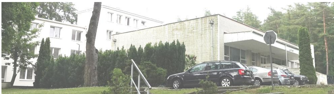
Fot. 6. Jastrzębia Góra, budynek „Bałtyk” Filii KSS, ul. Bałtycka 28, segment B – elewacja południowa, segment C – elewacja zachodnia i południowa.