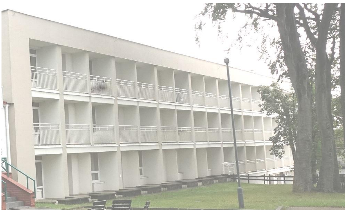
Fot. 10. Jastrzębia Góra, budynek „Bałtyk” Filii KSS, ul. Bałtycka 28, elewacja północna (segment B).