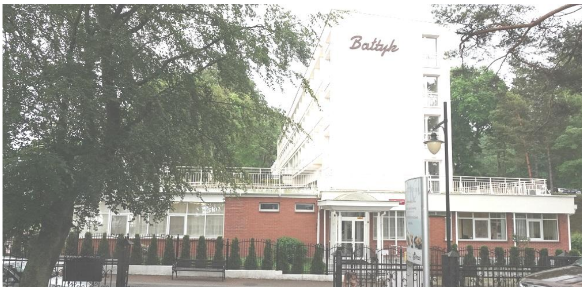
Fot. 2. Jastrzębia Góra, budynek „Bałtyk” Filii KSS, ul. Bałtycka 28, segment A – elewacja zachodnia, segment B – elewacja północna i zachodnia.